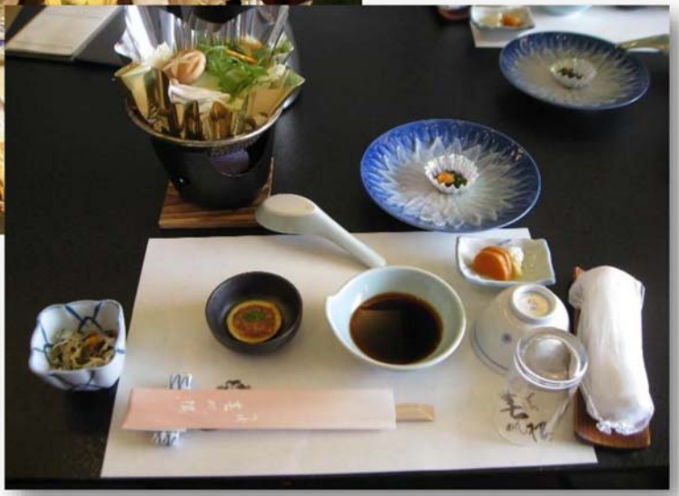
春帆楼でふぐ料理を頂きました